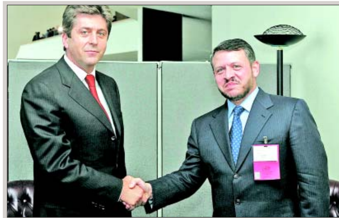
Президентът Георги Парванов и крал Абдулах Втори на среща на ООН, 2005 г.

ние. А всъщност тя е много проста. Трябва само да имаш сърце да я носиш и да доказ-